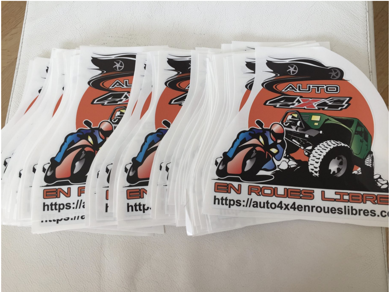
Team Auto4X4 en roues libres